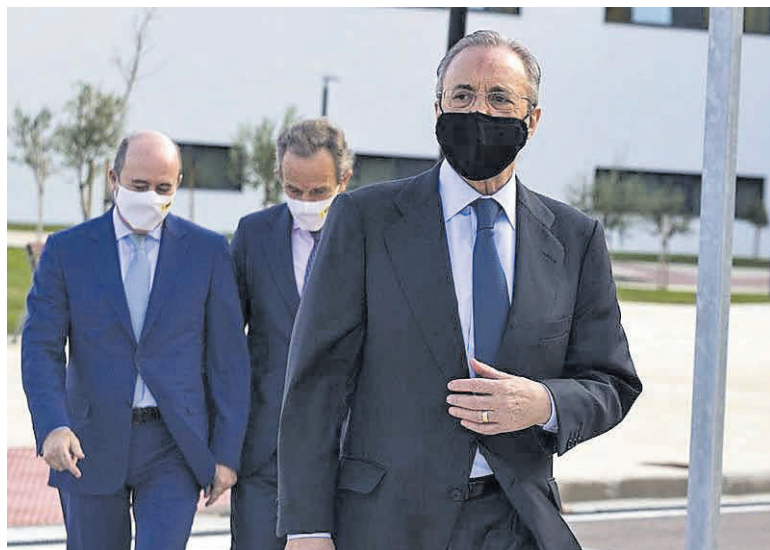
Florentino Pérez, durante la inauguración del hospital en noviembre de 2020.