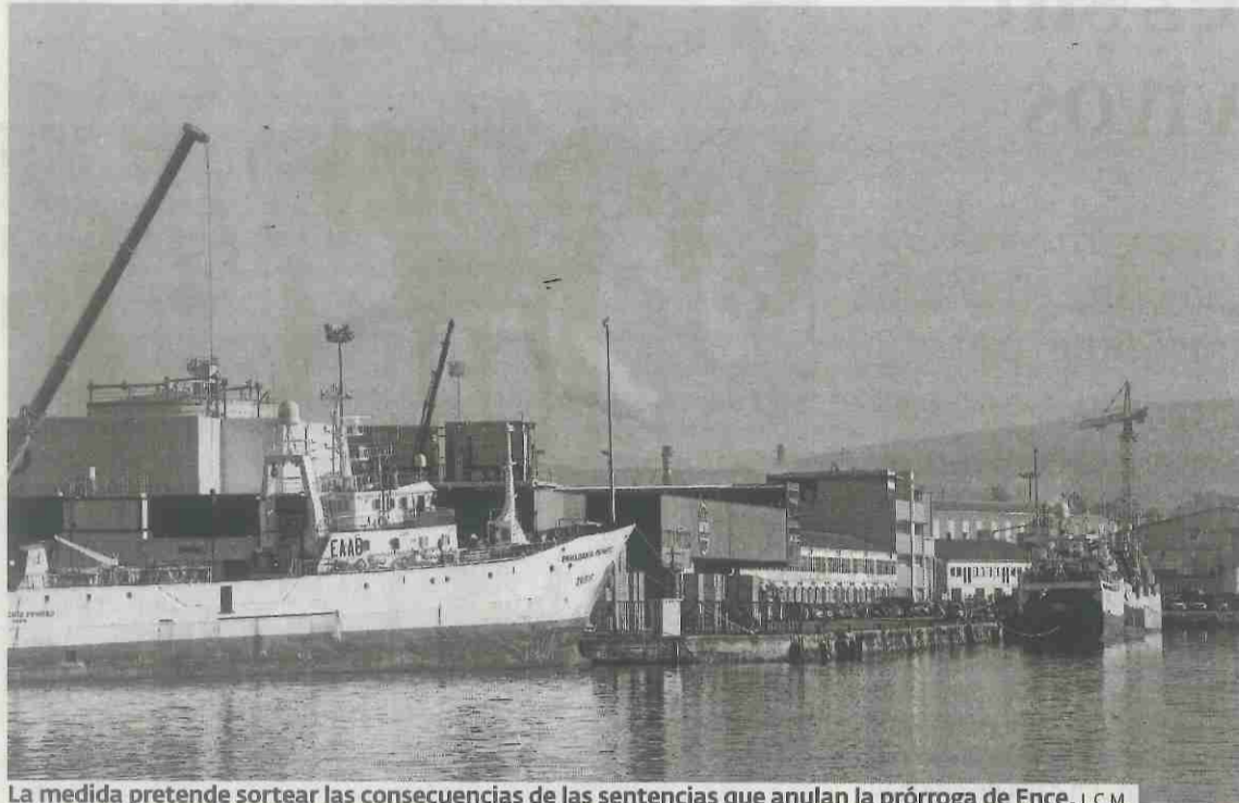
La medida pretende sortear las consecuencias de las sentencias que anulan la prórroga de Ence. J. C. M.

En la reunión se informó también a los integrantes del Consejo sobre los resultados del informe del Consello Consultivo de Galicia, que ya concluyó de forma unánime en octubre la viabilidad del proyecto. El grupo de asesores jurídicos de la Xunta y las administraciones públicas gallegas