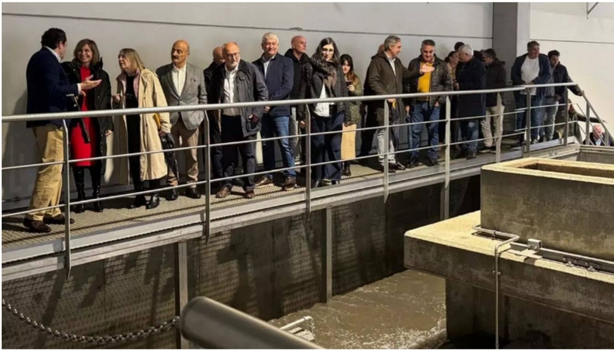
Autoridades y vecinos, ayer, en la inauguración de la nueva depuradora de Pontearreas.