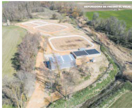
DEPURADORA DE FRESNO EL VIEJO