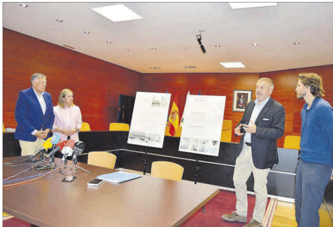
El alcalde y la conselleira, con los autores del proyecto, ayer, en Sanxenxo.

El Concello convocó un concurso de ideas para la ejecución de una intervención integral en la que se incluye el nuevo edificio del mercado y dependencias municipales. La propuesta ganadora, además de la dotación de ese nuevo equipamiento municipal,