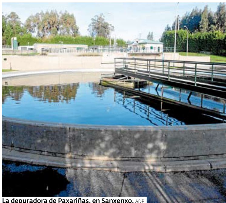
La depuradora de Paxariñas, en Sanxenxo. ADP

A lo largo de este verano se avanzó en el procedimiento expropiatorio levantando las actas previas de ocupación que permitan la disponibilidad de los terrenos. A