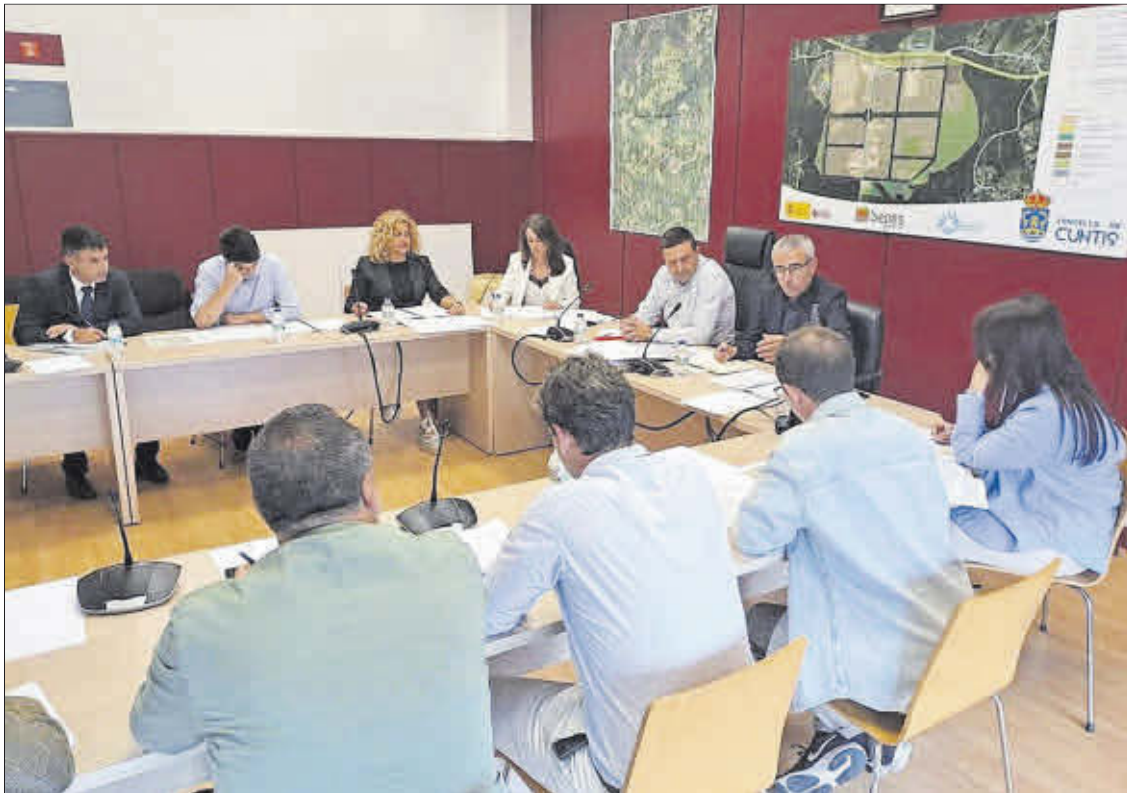
Reunión en Cuntis de la Comisión de Seguimiento del polígono empresarial e industrial de A Ran.