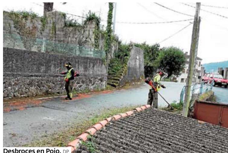
Desbroces en Poio. DP

servizo esencial, e traballamos coordinados para intentar chegar a todo coa maior axilidade posible. O seguimento é continuo e todas as zonas están perfectamente detectadas», explica.