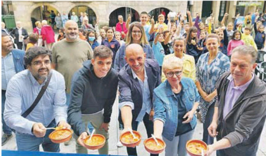
Presentación de la Festa dos Callos, ayer al mediodía en O Porriño, con degustación.