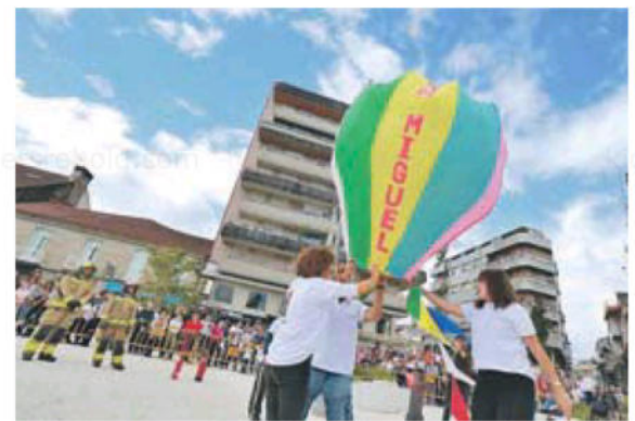
Uno de los globos intentando elevarse desafiando al viento.

El consejo de administración de Aguas de las Cuenas del Estado, ACUAES, dependiente del Ministerio para la Transición Ecológica y el Reto Demográfico autorizó, autorizó ayer jueves, la adjudicación, por 8 millones de euros, de la redacción del proyecto, ejecución y puesta en marcha de la ampliación de la Depuradora, EDAR, de A Moscadeira, en Pontareas, con un plazo total de 30 meses: 5 meses para el proyecto constructivo, 19 para la acometer la obra y 6 meses para su puesta en funcionamiento. Entre las cuatro ofertas presentadas, ACUAES seleccionó Copasa. La actuación, declarada de interés general del Estado, que beneficiará a una población de 20.000 habitantes, tiene por objeto aumentar la capacidad de la actual EDAR, mejorar la calidad de los vertidos sin depurar al río Tea y mejorar el saneamiento del municipio. ■