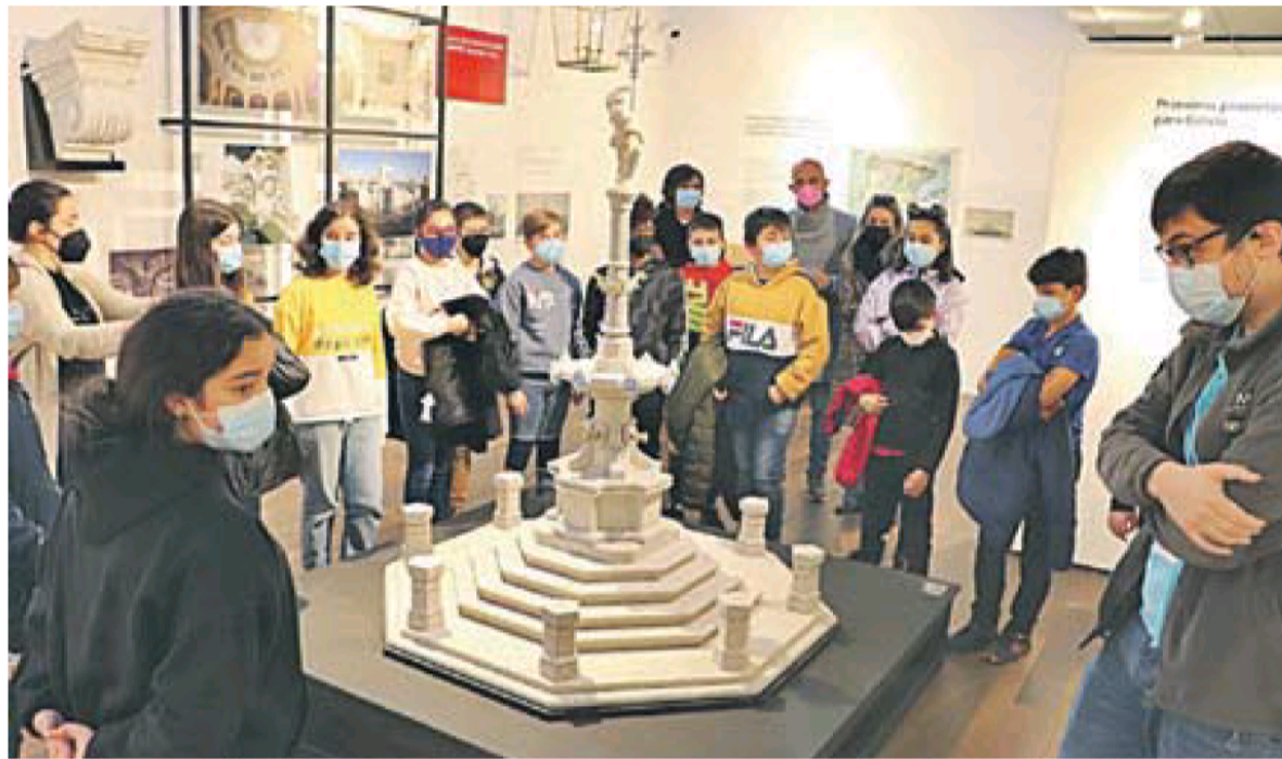
Escolares, alcalde y profesores, contemplan muy atentos la maqueta a escala de la Fonte do Cristo, de Palacios.

res en participar han sido el CEIP Plurilingüe de Atios y el CEIP Plurilingüe Antonio Palacios. Y en próximas fechas lo hará el alumnado del IES Ribeira do Louro, CPR Hermanos Quiroga, CPR Santo Tomás, el CEIP da Ribeira y el CEIP Cruz Budiño.