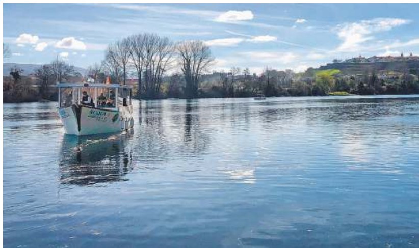
El proyecto pretende brindar una experiencia turística en barco y con el Miño con nexos.

Desde hoy las personas interesadas podrán realizar sus reservas en www.hemisferios.org o en el teléfono (+34) 620900265 para realizar las rutas a partir del viernes.