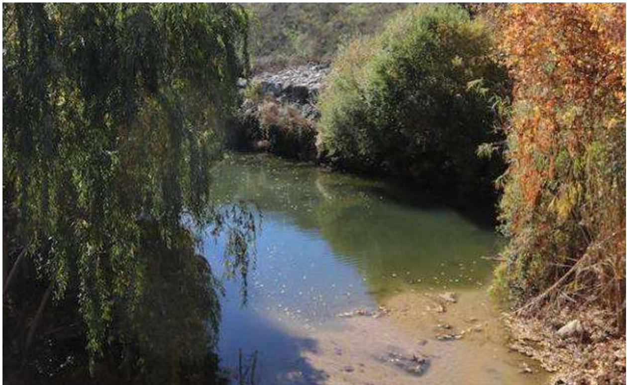
Un tramo del Guadiaro.

La infraestructura se financiará con 5,4 millones de fondos europeos