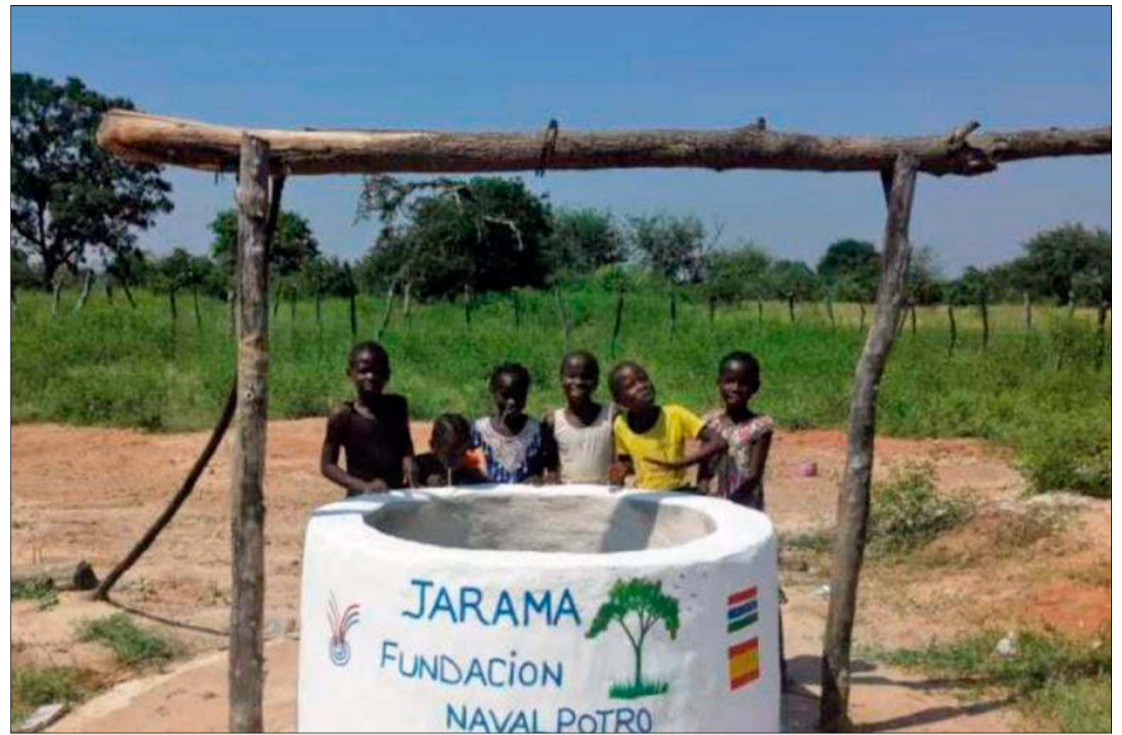
Pozo de la Fundación Navalpotro en Gambia. HDS

Además, el acceso al agua tiene un marcado componente de discriminación de género: habitualmente son las mujeres y niñas quienes se encargan de conseguir agua para las familias. De media, las mujeres y niñas de los países en vías de desarrollo caminan 6 kilómetros al día, transportando 20 litros de agua, lo que reduce de manera considerable el tiempo que podrían utilizar para otro trabajo o para asistir a la escuela. Resumiendo: el nivel de civilización de una sociedad se mide por el grado de protección del bien común y de cumplimiento de los derechos humanos. Puesto que el agua es una necesidad