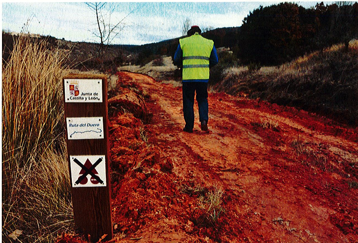
Obras previas de la depuradora.

La reunión de la Comisión de Seguimiento analizó ayer el estado del proyecto Nuevo giro en el proyecto de la nueva depuradora de Soria. La única parte de la iniciativa ya adjudicada, la propia EDAR, tendrá que licitarse otra vez en los próximos meses. Acuaes ha realizado algunas modificaciones en el propio proyecto y ha rescindido el contrato con la adjudicataria. En las próximas semanas se espera la aprobación definitiva del nuevo proyecto y la posterior licitación, según confirmaron fuentes del Ayuntamiento de Soria.