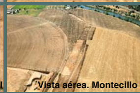
Vista aérea. Montecillo II