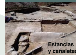
Estancias y canaletas