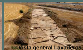
Vista general Lavaderos II