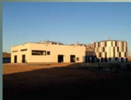
Edificio de digestión