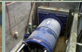
Microtunneladora en foso de ataque