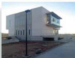
Edificio de control