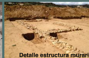
Detalle estructura muraria