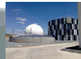
Vista parcial EDAR