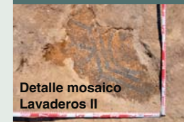
Detalle mosaico Lavaderos II