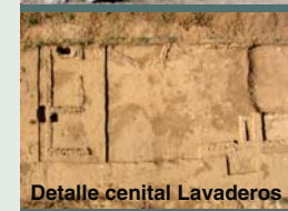
Detalle cenital Lavaderos II