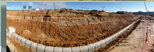
Galería. Tramo en ejecución