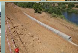
Vista alineación galería