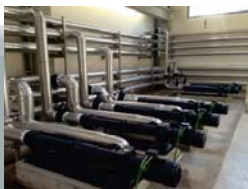
Calentamiento de fangos